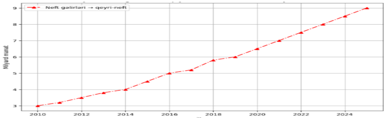
Şəkil 3. Qeyri –neft sektoruna investisiyalar

Digər mühüm göstərici qeyri-neft ixracının artımını əhatə edir. Neft gəlirlərinin subsidiyalar və investisiya təşviqi mexanizmləri vasitəsilə qeyri-neft məhsullarının ixracını artırmağa yönəlməsi, 2010-cu ildən başlayaraq bu sahədə əhəmiyyətli yüksəlişə səbəb olmuşdur. Bu artım, ölkənin xarici ticarət balansını müsbət istiqamətdə dəyişmiş və qeyri-neft məhsullarına olan tələbatı artırmışdır. Bu isə, iqtisadiyyatın şaxələndirilməsinə, xarici bazarlarda daha çox rəqabət qabiliyyətli məhsulların istehsalına və ixraca yönəlik strategiyaların uğurlu olduğunu göstərir. Sosial göstəricilər sahəsində də müsbət tendensiyalar müşahidə olunmuşdur[5]. Regionlarda yeni iş yerlərinin yaradılması və insanların gəlir səviyyəsinin yüksəlməsi qeyri-neft sektorunun sosial-iqtisadi təsirini gücləndirmişdir. Bu, bölgələrdə yoxsulluğun azaldılmasına, həyat səviyyəsinin yaxşılaşmasına və sosial sabitliyin təmin olunmasına kömək etmişdir.